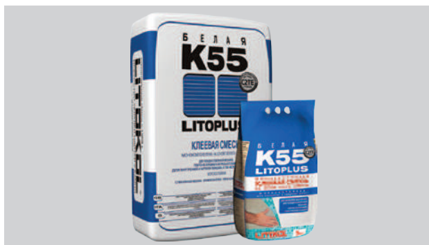
Мешки 25 кг трехслойные, из двух слоев бумаги с промежуточным слоем из полиэтиленовой пленки. Мешки 5 кг из металлизированной пленки.

Изготовитель оставляет за собой право совершенствовать состав продукции, вследствие чего некоторые её свойства могут значительно отличаться от вышеуказанных. Изготовитель сохраняет за собой право вносить изменения в данное техническое описание, связанные с совершенствованием технологий. С выпуском настоящего технического описания все предыдущие становятся недействительными. Изготовитель не несёт ответственности за неправильное использование материала, а также за его применение в целях и условиях, не предусмотренных инструкцией. Работы необходимо выполнять в соответствии со строительными нормами и правилами (СНиП). Инструкция не заменяет профессиональной подготовки исполнителя. В каждом конкретном случае применения материалов LITOKOL , имеющего отклонения от инструкции, требуется опытная проверка потребителем, так как вне влияния производителя остаётся ряд факторов, особенно если одновременно используются материалы других фирм. Инструкция производителя содержит данные и рекомендации, основанные на собственном опыте и проведённых исследованиях, и не учитывает какие-либо специфические условия. Инструкция носит рекомендательный характер и не может являться основанием для предъявления претензий имущественного характера. Если у Вас возникнет необходимость в консультации относительно применения продукции LITOKOL , обращайтесь, пожалуйста, в сервисную консультационную службу LITOKOL .